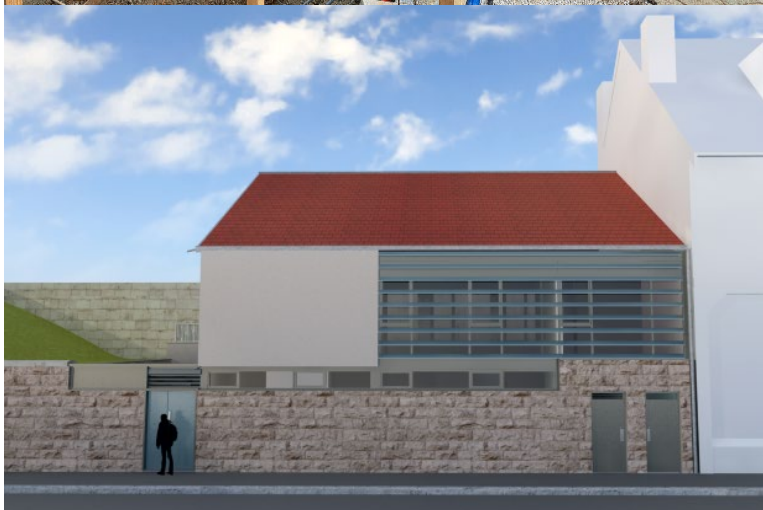
De la démolition à la situation future, début 2025