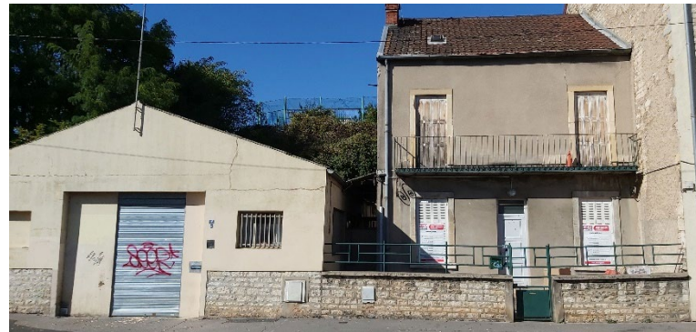
Les bâtiments de l'Accueil de Jour de 1986 à 2022

Les travaux se déroulent donc enfin suivant le calendrier préétabli et nous laissent penser que le nouvel accueil de jour sera terminé à la fin du mois de janvier 2025.